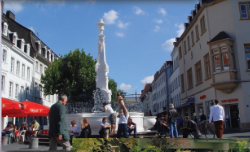
Impressionen aus Saarbrücken, Bilddatenbank Tourismuszentrale Saarland